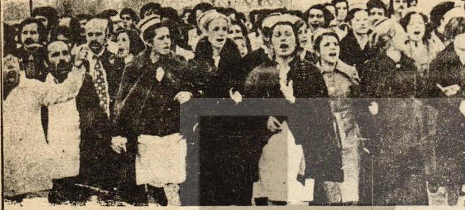
Hacettepe doktor, hemşire ve personeli yürüyor: "KATİL İKTİDAR"

Kısa adı TÜS-DER olan Tüm Sağlık Elemanları Derneği Ankara Şubesinin Genel Kurulu 11 Eylül'de toplanıyor.