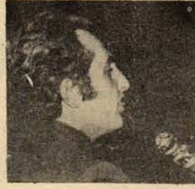
Türk Harb-İş Genel Başkanı Kenan Durukan'ın Türkiye-Yunanistan dostluğunu ve Ege konularında dergimize verdiği demeci yayınıyoruz.